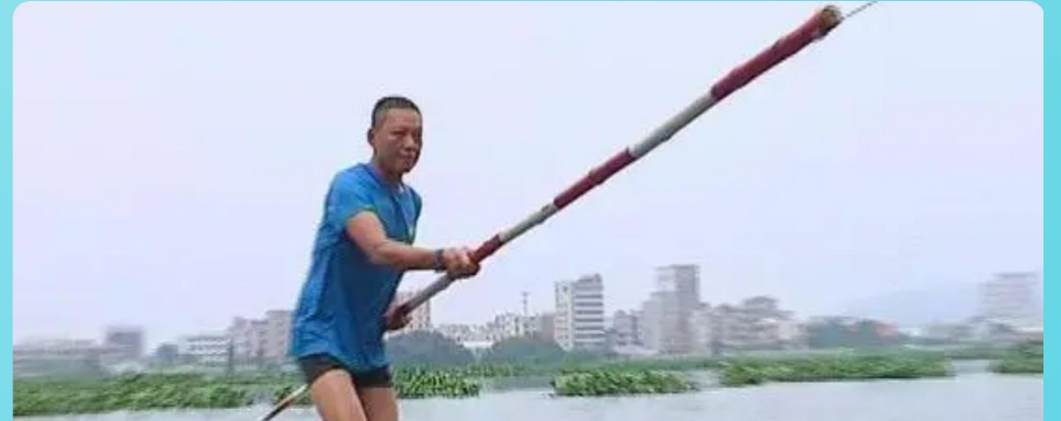
正確的岸上救援示範：使用竹竿或救生設備從岸上幫助溺水者

在岸邊尋找可以幫助溺水者的物品，例如救生圈、竹竿、樹枝、繩子、甚至脫下的衣服等，從岸上伸給或拋給溺水者，切勿貿然下水救人。